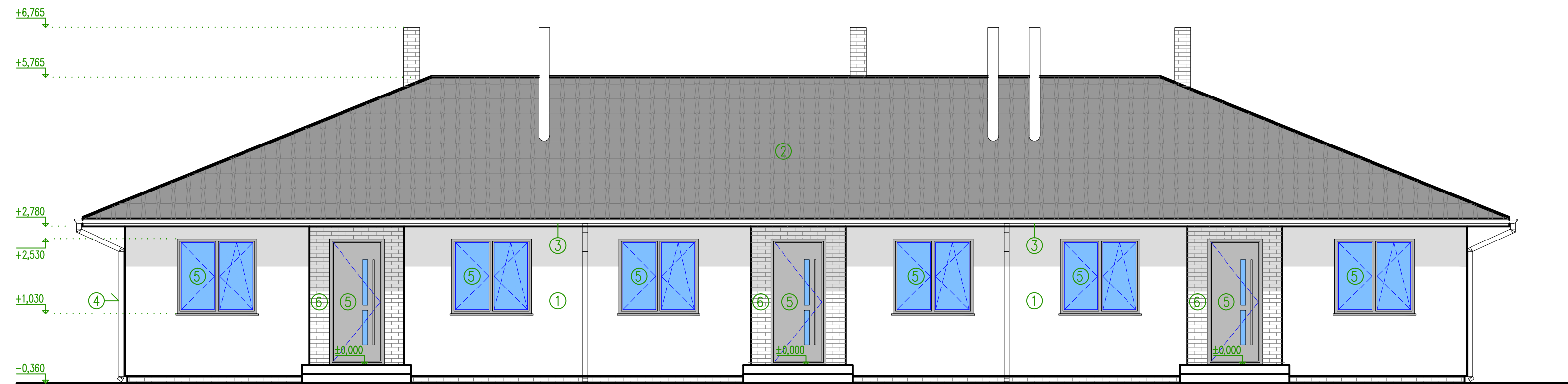
POLAD BOČNÝ PRAVÝ